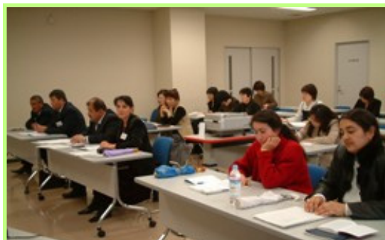
カントリーレポート検討会